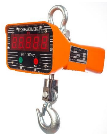
Рисунок 2. Общий вид весов крановых OCS

Общий вид весов представлен на рисунке 2.